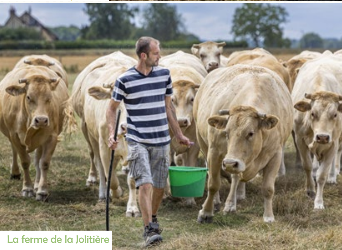
La ferme de la Jolitière